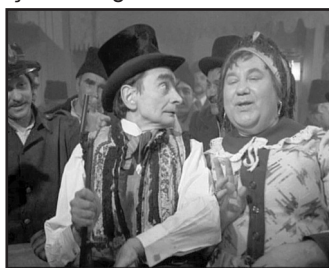
Horia Căciulescu în serialul TV „Toate pânzele sus!”

impresionantă: „Toate pânzele sus!” (1978), „Tufa de Venetia” (1976); „Comedie fantastică” (1974), „Sentința” (1970); „Corigența domnului profesor” (1967); „Titanic vals” (1963); „S-a furat o bombă” (1961); „Telegrame” (1959); „O poveste obișnuită... o poveste ca în basme” (1958); „D-ale carnavalului” (1958); „Pe răspunderea mea” (1955); „Și Ilie face sport” (1954). A fost unul dintre cei mai apreciați interpreți ai Teatrului Radiofonic, la microfonul căruia a putut fi auzit în piesele „Bolnava prefăcută”, „Cafeneaua anului 1900”, „Călătorului îi șade bine cu drumul”, „Moș Teacă și epizootia”, „Nasul”, „Nunta lui Figaro” sau „Un scos din pepeni”. În anul 1968 Consiliul de Stat al României, prin Decretul nr. 797/1968, i-a conferit lui Horia Căciulescu ordinul și medalia Meritul Cultural clasa I.